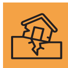
Malta p. 6 – 7