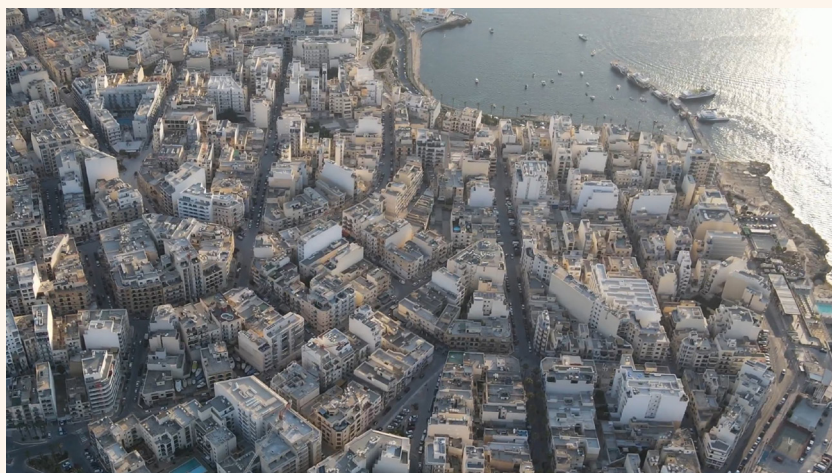
Malta bovenaanzicht. Bron: Reġjun Tramuntana