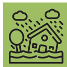
Rotterdam p. 8 – 9